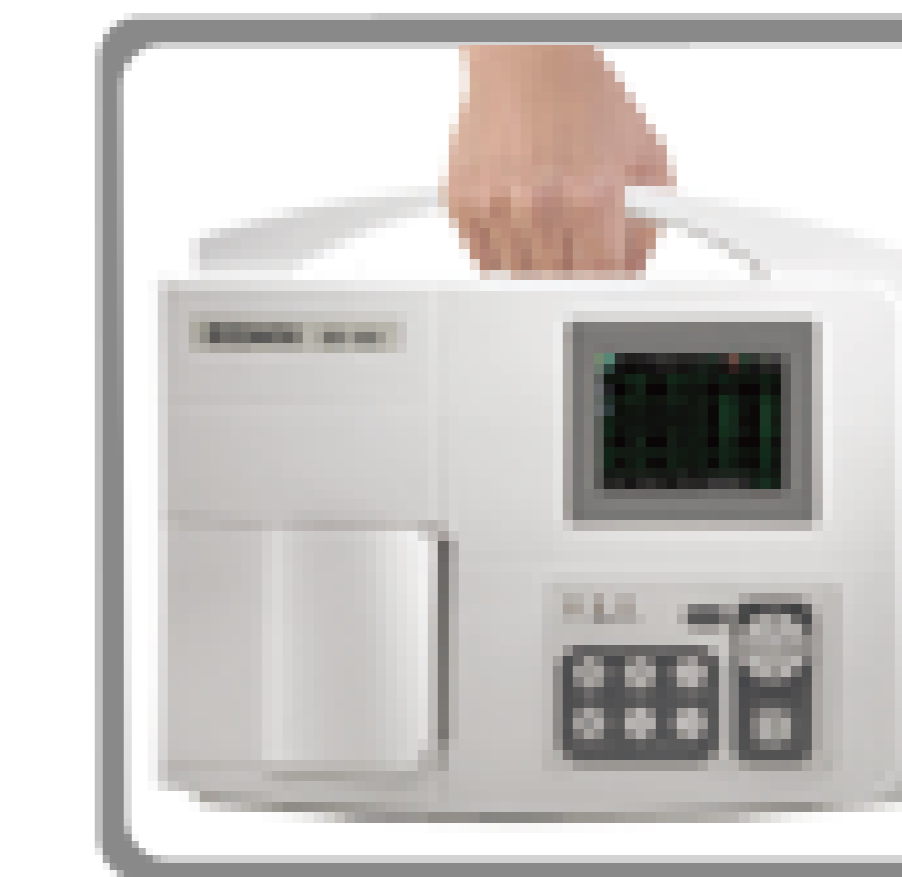
Diseño Portátil (Manejo Opcional)