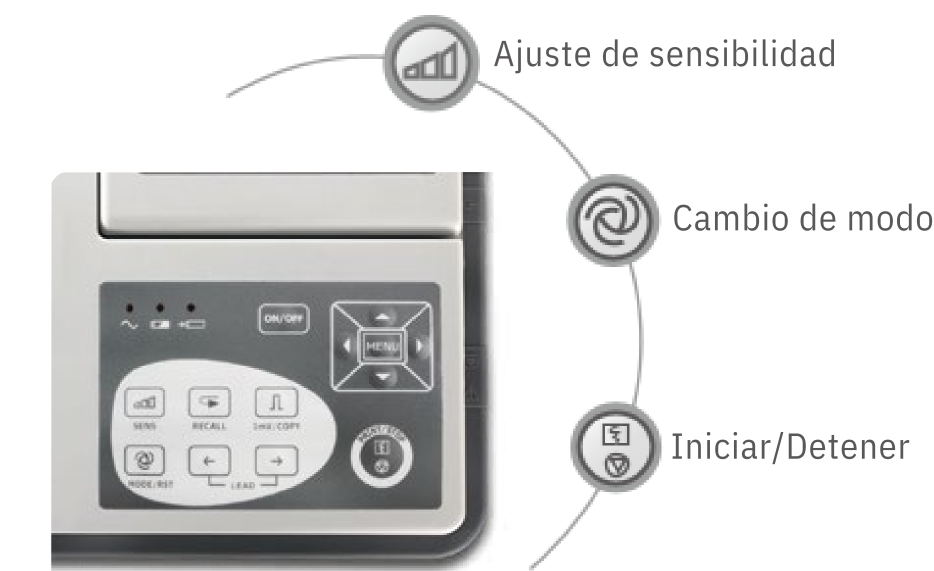
Funcionamiento con un botón