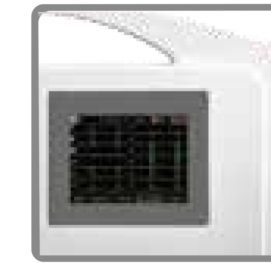
Visualización de formas de onda de 12 derivaciones